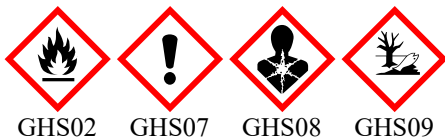
GHS02 GHS07 GHS08 GHS09